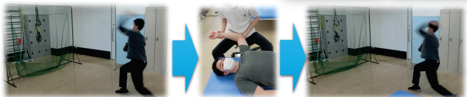
リハビリ前の測定